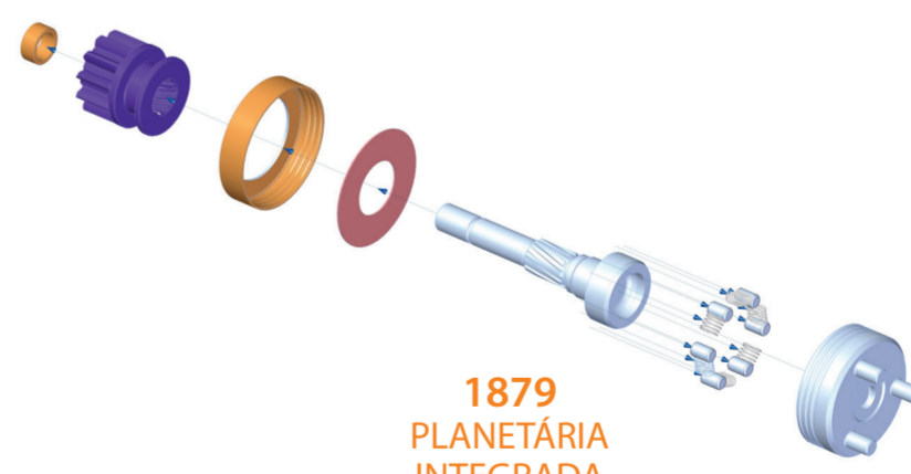
1879 PLANETÁRIA INTEGRADA

A ZEN possui dois itens para reposição deste modelo: 1879 e 1875, veja suas aplicações em nosso catálogo.