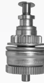
INERCIAL COM REDUÇÃO